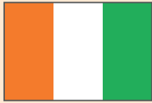
República de Côte d'Ivoire