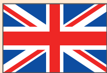
Reino Unido de Gran Bretaña e Irlanda del Norte