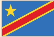
República Democrática del Congo