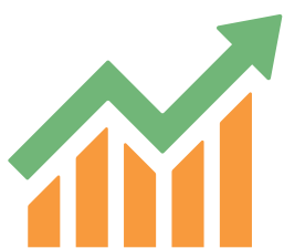
Desarrollo de los mercados y el comercio

Basándose en los principios de colaboración, los cuatro grupos de trabajo temáticos, bajo la dirección de los cofacilitadores, compartieron ideas, intercambiaron prácticas recomendadas y debatieron sobre las acciones que los países podrían emprender de forma conjunta. Partiendo de esa base, los copresidentes, el Reino Unido e Indonesia, han identificado las siguientes medidas para seguir debatiendo, desarrollando y aplicando, según proceda. Estas acciones no son exhaustivas ni vinculantes y no se aplican en todas las circunstancias a todos los países. Se trata de un trabajo en curso y los participantes han expresado su deseo de aumentar la colaboración, a través de este diálogo, después de la COP26.