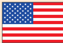
Estados Unidos de América