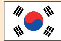
República de Corea