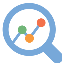
Trazabilidad y transparencia