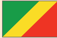
República del Congo