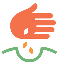
Apoyo a los pequeños agricultores